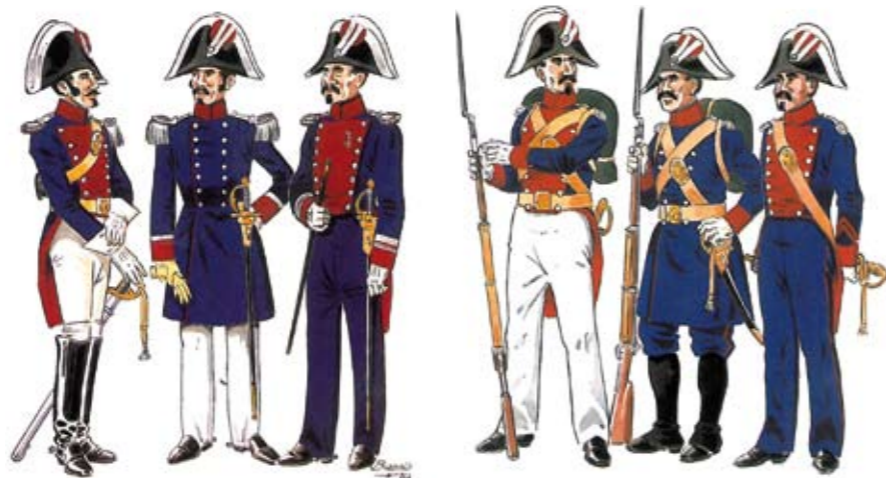
Tres Oficiales y tres de Tropa con los uniformes fundacionales.

El 28 de marzo se publicaba el Decreto de creación de una "fuerza especial de Infantería y Caballería, bajo la denominación de Guardias Civiles" quedando el Ejército encargado de su organización, con el Duque de Ahumada, en ese momento Mariscal de Campo (hoy General de División) como responsable máximo. Tras un exhaustivo estudio en el que se analizaron tanto modelos europeos como otros genuinamente españoles (como los Mozos de Escuadra catalanes), propuso una serie de modificaciones al estatuto inicialmente previsto para el Cuerpo. Aprobadas por la Reina, la definitiva organización quedó recogida en el Decreto de fundación de la Guardia Civil, firmado por Isabel II el 13 de mayo de 1844. La Guardia Civil constituía una fuerza con vocación nacional y com-